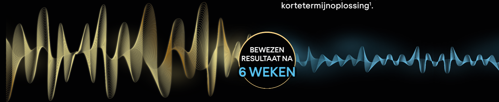
Figuur 1. VERBETERING VAN STRESSGERELATEERD GEDRAG 1

De werking van PRO PLAN ® Calming Care is aangetoond na 6 weken dagelijks gebruik en het kan het beste gedurende langere tijd worden gegeven in plaats van als kortetermijnoplossing 1 .